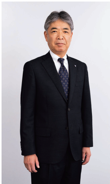
児玉化学工業株式会社 代表取締役社長